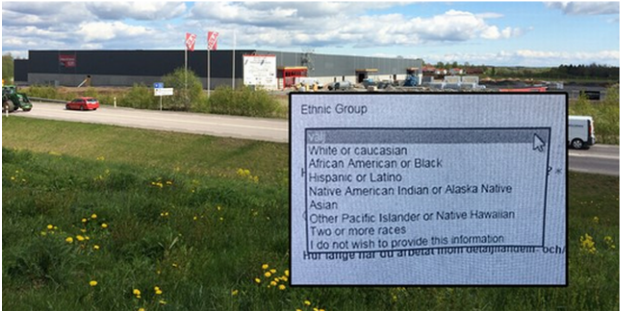
Infällt i bilden är formuläret som de arbetssökande till Julas varuhus i Skövde fick klicka i.